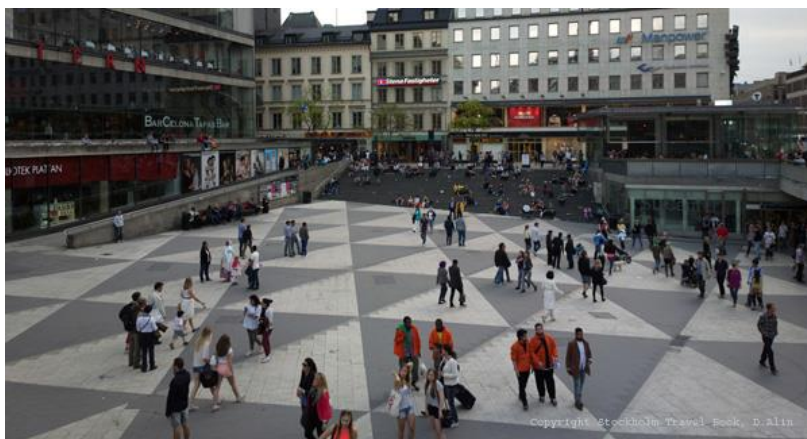
”Plattan” – Sergels torg i Stockholm