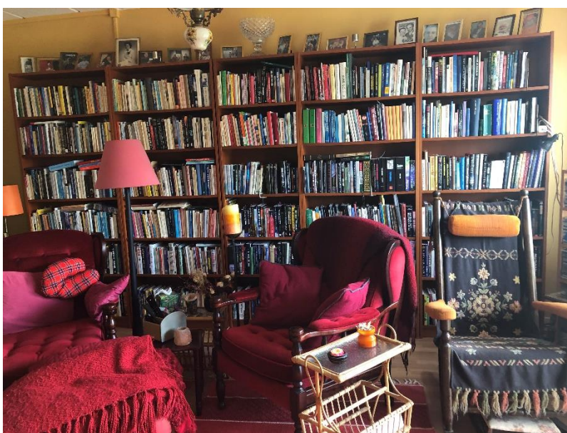
Visar en del av biblioteket – för att få förståelse... ☺

Jag vill också kort berätta om NewAge-centret Findhorn i Skottland. Jag läste för många år sedan boken ” Findhorns trädgårdar ” som publicerades år 1979. Det jag minns som har koppling till detta tema är att Eileen Caddy och hennes man och väninna var ute på bilresa i norra Skottland. När de gjorde en paus på resan, vid Findhorn, och satt på en bänk, såg Eileen Caddy en liten varelse framför sina fötter. Hon började prata med honom. Han blev så förvånad över att hon såg honom. Resultatet av mötet blev att varelsen, vätten, lovade att om paret Caddy och väninnan stannade i Findhorn och skapade trädgårdar så skulle vättarna hjälpa dem. Jag minns att kålhuvudena blev mycket stora och att de grönsaker de odlade blev helt fantastiska. Det lockade massor av människor att besöka trädgårdarna, vilket ledde till att paret Caddy och väninnan började skapa det som numera är ett berömt centrum för New Age-rörelsen. Jag letade i bokhyllorna efter boken men hittade den inte. Efter mitt flytt har böckerna ändrat plats... ☺.