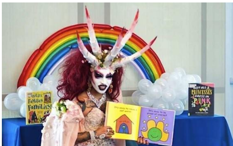
En ”drag queen” läser sagor för barnen

KG berättar ingående om den satanistiska kultur som utvecklats under senare år, något jag sett bli alltmer påtagligt, i synnerhet inom kulturen och filmindustrin. Han berättar att Liseberg har en ny attraktion, ett ” skräckhus ” och skriver ” Vad händer när vi leker med demoner på detta sätt? Vilket ansvar har Liseberg för konsekvenserna av att medvetet bygga upp sin nöjespark till demonernas fäste? Framför allt: Vad händer med de som utsätter sig för detta? ” (s. 87). Och jag erinrar mig informationen om att satanismen är en ganska stor ”religion” i världen och barnen börjar på olika sätt indoktrinerats mycket tidigt. 16