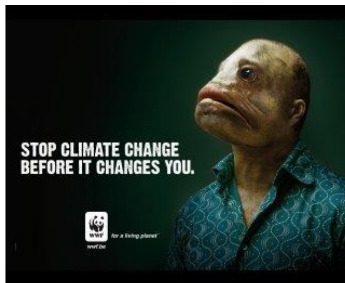
Ett modernt exempel på förrädisk indoktrinering. 5

Min uppfattning är att det nu är viktigare än någonsin att lyssna på dessa råd.