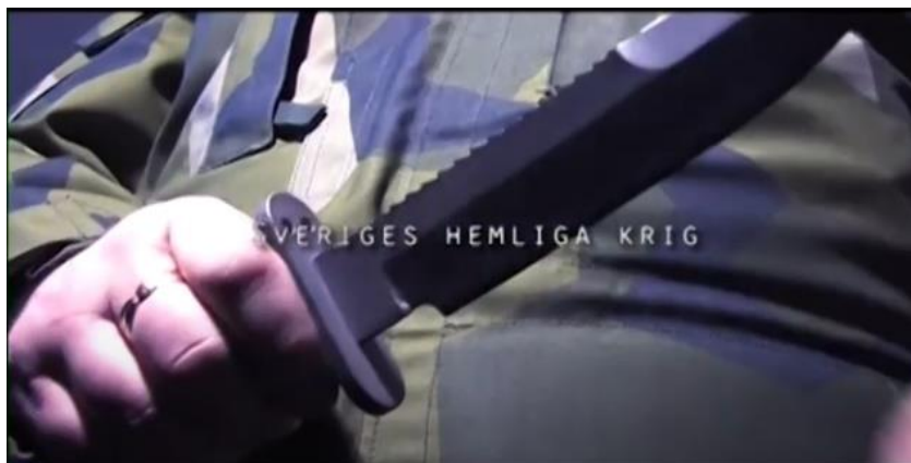
Den tandade kniven. Bilden är hämtad från videon om teamet 4

”sylvasst unikt stål” (s. 29). Det är bara några av de otroliga vapen Eugen och hans teamkamrater är utrustade med i situationer där de behöver vara beväpnade.