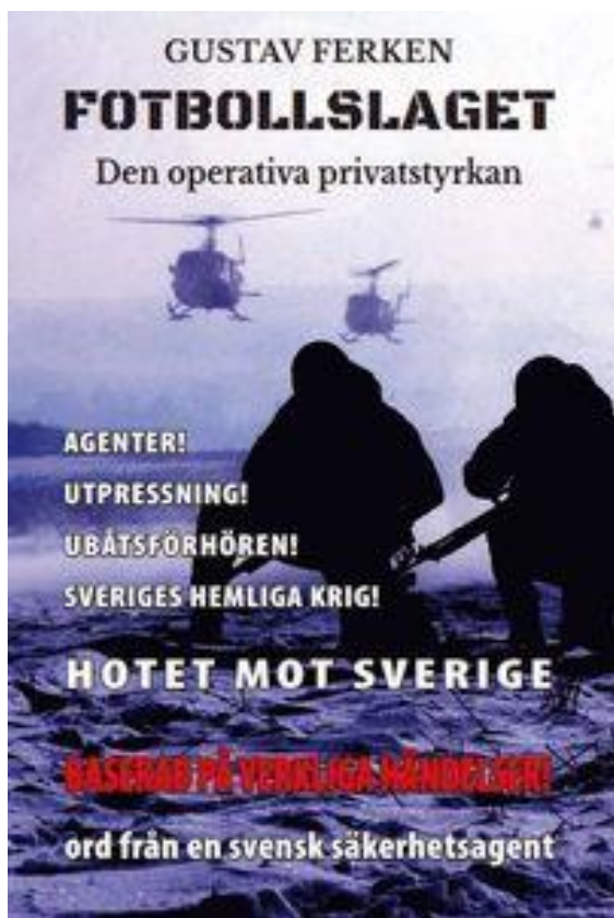
Första upplagans framsida