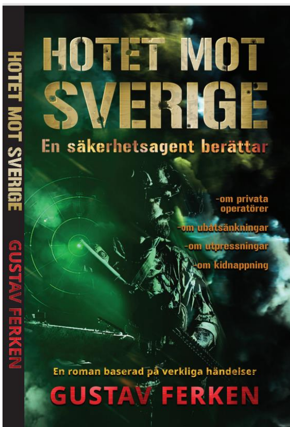
Andra upplagans framsida