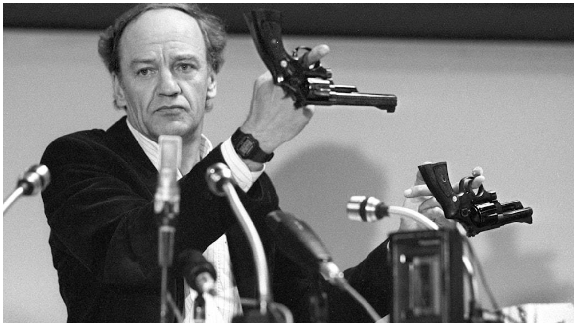
Detta är väl den mest kända bilden från Hans Holmérs presskonferens.

Hans Holmér blev en viktig kugge och får ”en egen liten betraktelse” i boken (s. 49).