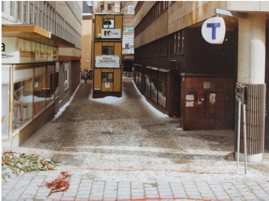
Barackerna på Tunnelgatan vid ”mordet”

händelsen till eftervärlden” (s. 11) ”Konstiga antenner på taket till den översta baracken skvallrar om något hemligt”.