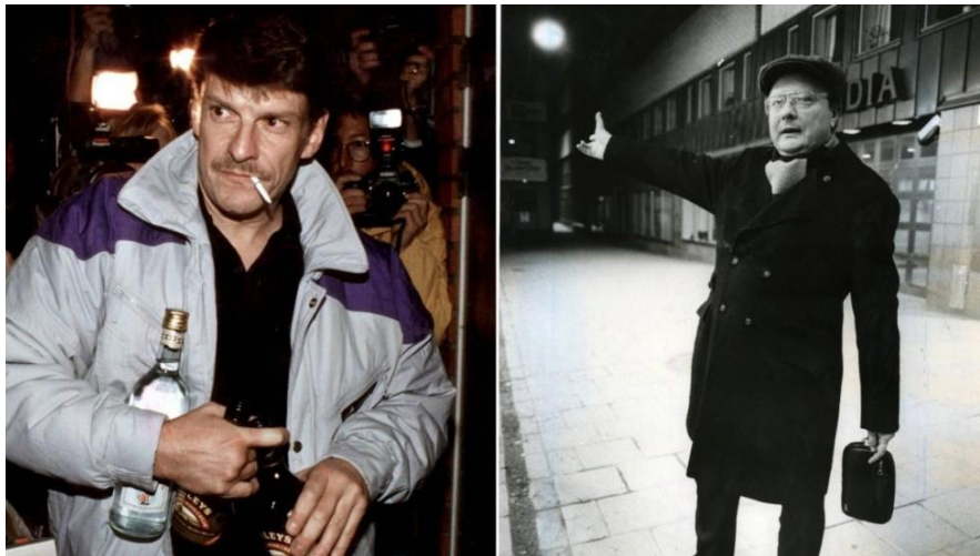
Christer Pettersson och Skandiamannen Stig Engström