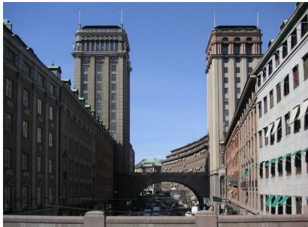
Norra Kungstornet är det till höger.