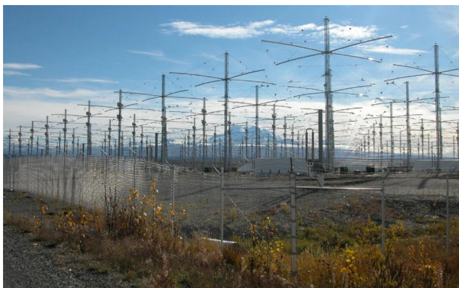
HAARPs antensystem i Alaska

I skrivande stund har den ohyggliga katastrofen i Hawaii, d.v.s. de omfattande bränderna på Maui, hänt. Katastrofen är enligt källor den dödligaste i Hawaiis historia. Alternativa media menar att bränderna startades med hjälp av DEW, Direct Energy Weapon . Bränderna drabbade bara skogen och de inföddas marker, inte miljonärernas tomter och hus.