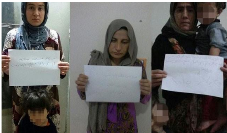
ISIS säljer kristna kvinnor 8

Än idag hålls kvinnor i burar för att säljas. IS bestämmer priset. De allra yngsta, småflickorna, är dyrast. Religionen ger mannen fullständig frihet när det gäller att äga kvinnor, både på jorden och i paradiset. ”Njutningen känner inga begränsningar” (s. 87).