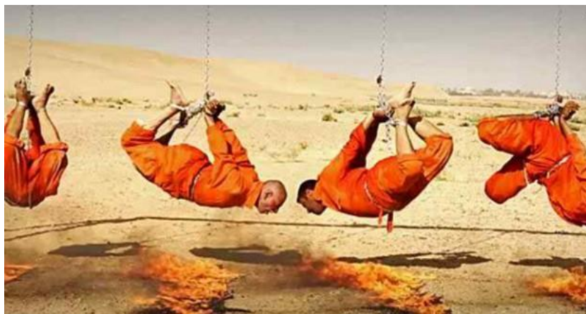
Här bränns fyra irakiska shiasoldater levande till döds. 7

Författaren beskriver att araberna förgör varandra. ”Man skär halsen av, utplånar och förödmjukar varandra. Daesh utrotar shiiter, yaziditer, sunniter...” (s. 175).