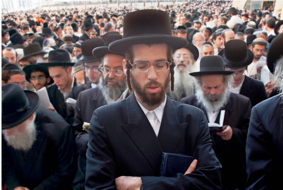
Bilden hämtade från Världens Historia 12