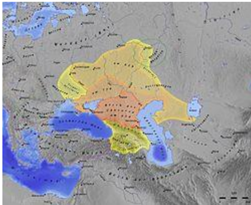
Ukraina låg i Khazarernas rike mellan år 488 och 800.

Författaren går inte närmare in på begreppet aschkenazijudar. Andra källor, exempelvis Arthur Koestler och Shlomo Sands beskriver i sina böcker Den Trettonde Stammen (1992) respektive The Invention of the Jewish People (2010) hur folkgruppen khazarer på 750-talet e.Kr. fördrevs från sitt land Khazarien och hur de tvingades konvertera till en annan religion än sin gamla hedniska – och valde judendomen och blev de som kom att kallas aschkenazi. Kort innebär detta att Israel inte är aschkenazijudarnas hemland utan Khazarien. 3 Många författare beskriver detta som en av de största historiska lögnerna. 4