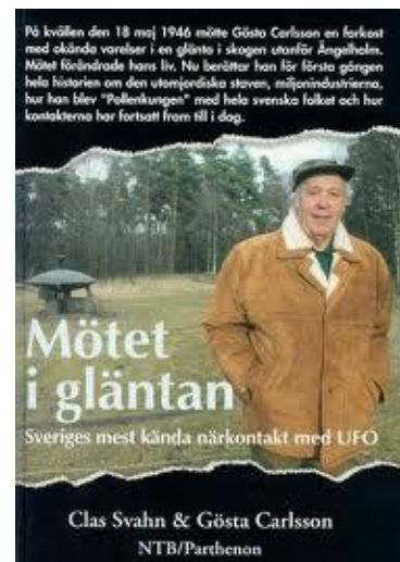
Några av Clas Svahns böcker