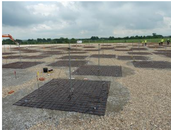
LOFAR-anläggning i England