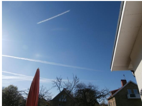
Över vårt hus den 25 april 2014