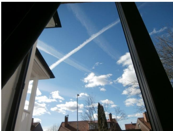
Över vårt hus i Örebro den 31 mars 2014

Man kan verkligen tro att detta är science fiction, men exempelvis Daniel Aili forskar vid Linköpings universitet om just självorganiserande nanomaterial. "Man kan beskriva det som ett lego som bygger sig själv, fast det är väldigt små bitar. Under vissa förutsättningar får man fram ett material med användbara egenskaper" , berättar han på universitetets hemsida. Utöver material för regenerativ medicin, vilket handlar om att snabba upp den hastighet med vilken kroppen kan läka sig själv och också att öka möjligheterna för kroppen att läka sig själv, kan dessa "byggklossar" användas för att tillverka biosensorer som bland annat utvecklas för läkemedelsscreening, för att upptäcka verksamma substanser, berättar universitetets hemsida.