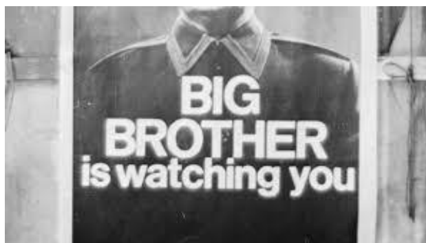
Från filmen om Orwells 1984

Man har avslöjat att tekniken används för att utveckla vapen som påverkar mänskliga energisystem och mentala processer. Dr Begick berättar om massor med amerikanska patent som beskriver teknik för att kontrollera och manipulera mentala, känslomässiga och fysiska tillstånd hos människor och djur.