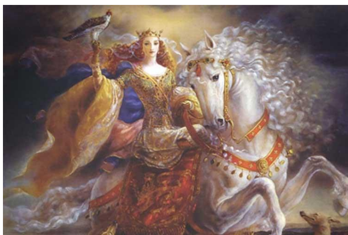
Eleonora av Akvitanien