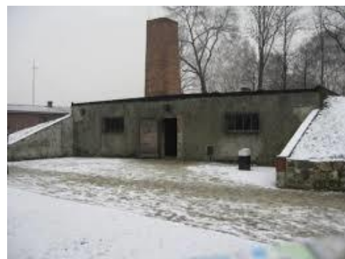
Skorstenen har blivit tillbyggd efter 1945 Fotot taget 2013