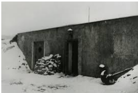
Krematoriet Auschwitz 1945 som påstods vara gaskammare