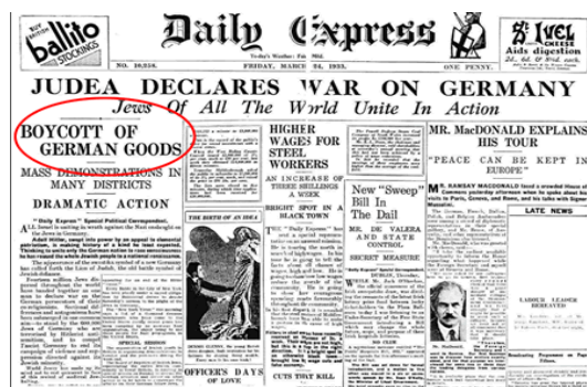
Daily Express i mars 1933