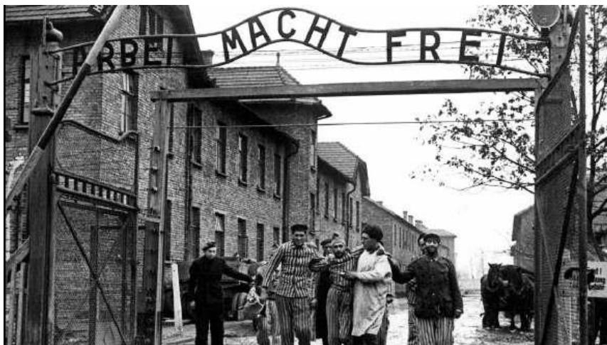
Bilden tagen vid befrielsen och är hämtad från ett intressant bildarkiv på Internet, som utarbetats av en ”förintelsetroende”. 11