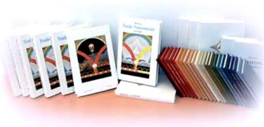
Martinus och hans samlade verk, ”Tredje Testamentet”