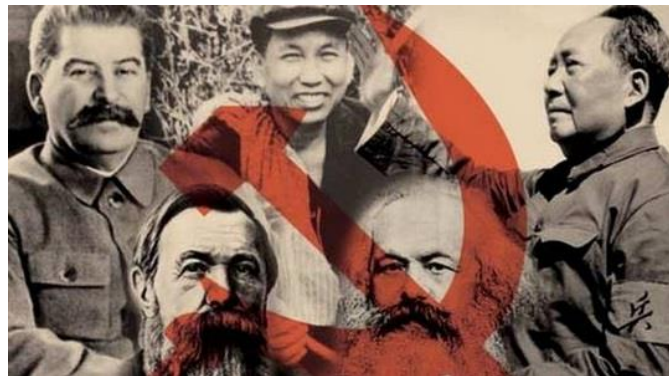
Stalin, Engels, Marx, Pol Pot, och Mao några av kommunismens förgrundsgestalter. 5

Magnus granskade redan som tonåring de olika vänsterrörelsernas syn på klasser och motsättningar mellan klasserna på ett analytiskt och begåvat sätt. Läsningen ger mig möjlighet att fundera över varför jag gjorde de ställningstaganden jag gjorde då. När Magnus tog ställning för den blodiga revolutionens nödvändighet, så var jag skeptisk, även om också SKP var för revolution, men jag minns inte att vi talade särskilt mycket och särskilt konkret om revolutionen och dess konsekvenser. Jag minns över huvud taget inte att vi någonsin talade om behovet av våld. Det var den frågan som några år senare fick mig att ta avstånd från kommunismen som ideologi och strategi. Som jag minns det talade vi om övertygelsens makt, i form av att vara goda förebilder, att göra goda handlingar, goda samtal och studier.