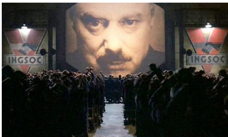
Bild från filmen byggd på George Orwells 1984