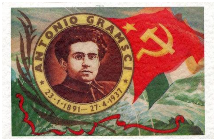
Bilden är hämtad från artikeln Stuart Hall: Gramsci and Us

Som en parentes kan jag nämna att en av dessa metoder är Agenda 2030 , som på ytan är förförisk och lätt att tycka att den är mycket viktig att genomföra, men som vid en djupare analys avslöjar den mörka hemliga agenda som Makteliten strävat efter i över 100 år. 44 Låt oss inte tas på sängen! Låt oss vara förberedda. Vem vet – dom där "konspirationsteoretikerna" har kanske rätt!