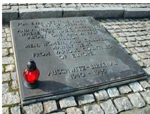
År 1995 ändrades antalet till 1,5 miljoner 11