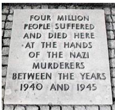
Originalplatta utanför Auschwitz-Birkenau 4 miljoner dödade

(s.145). Siffran används dock fortfarande av exempelvis Wikipedia. En intressant uppgift som Wilhelmson kommer med är att siffran 6 miljoner används tidigare. Siffran 6 miljoner ”är helig” (s.131). Redan på 20-talet pratade sionister på Wall Street om 6 miljoner judar som skulle dö. ”Siffran kommer därifrån”, menar Wilhelmson (s.131). I New York Times år 1920 användes siffran ”i samband med en kampanj till stöd för judar i Europa” (s.146). Dessutom har begreppet holocaust använts tidigare. ”I den judiska tidningen The American Hebrews , den 31 oktober 1919, skriver man om att just 6 miljoner judar hotas av en förestående holocaust ...” (s.146).