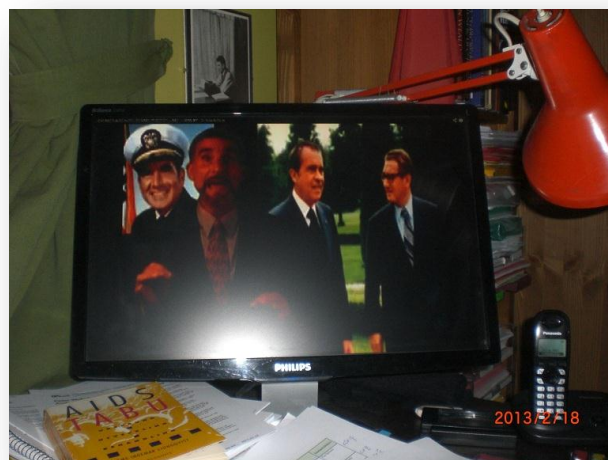
Ur "The Emperors new Virus"

Enligt Wikipedia: The Other Side of AIDS is a 2004 documentary film by Robin Scovill. Through interviews with prominent AIDS denialists and HIV-positive people who have refused anti-HIV medication, the film makes the claim that HIV is not the cause of AIDS and that HIV treatments are harmful, conclusions which are rejected by medical and scientific consensus. The film was reviewed in Variety and The Hollywood Reporter in 2004, and received additional attention in 2005, when Scovill's three-year-old daughter died of untreated AIDS.