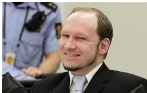
Kvinnorna som älskar Breivik 3