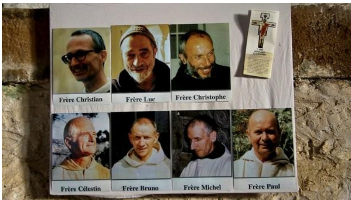
De mördade sju munkarna.