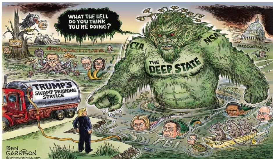
Ben Garrisons politiska teckningar är mycket talande.

När Donald Trump blev president lovade han att ”dränera träsket”, vilket han och Vita hattarna gjort sen dess.