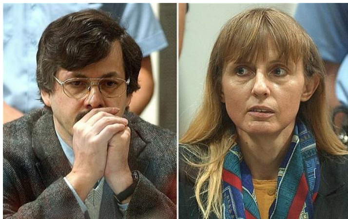
Marc Dutroux och hans hustru Michelle Martin vid rättegången år 2004