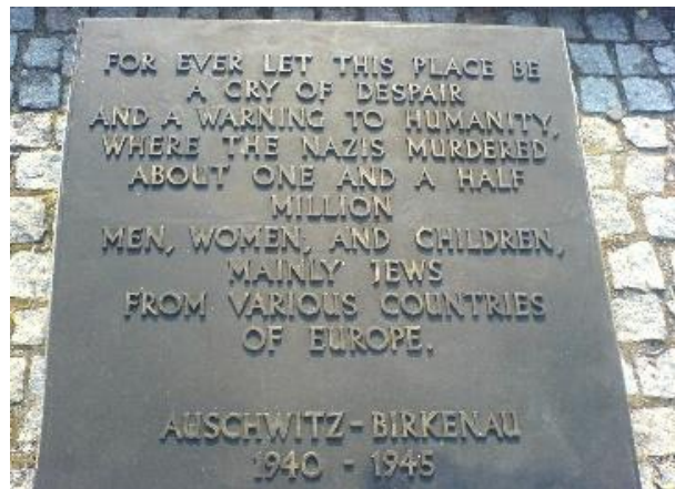
En och en halv miljon

Ännu en siffra presenteras av Röda Korset som hade tillträde till de nationalsocialistiska koncentrationslägren och dokumenterade alla dödsfall. Däremot hade de inte tillgång till de ryska, franska och engelska koncentrationslägren.