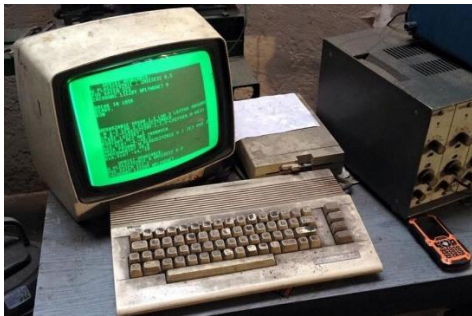
Commodore 64

Commodore 64 . Han fick sitta i sin pappas knä och se hur den fungerade i början. Detta bör alltså ha varit omkring år 1989. Det var ungefär samtidigt som jag fick se den första datorn, en Mac Plus . Det bör ha varit 1988.