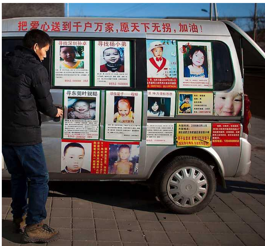
Kinesiska föräldrar efterlyser sina bortrövade barn på en ambulering skåpbil. 22

På senare tid har man börjat tala om de stulna adoptivbarnen från Chile. 20 Samt även de stulna barnen från Kina. 21